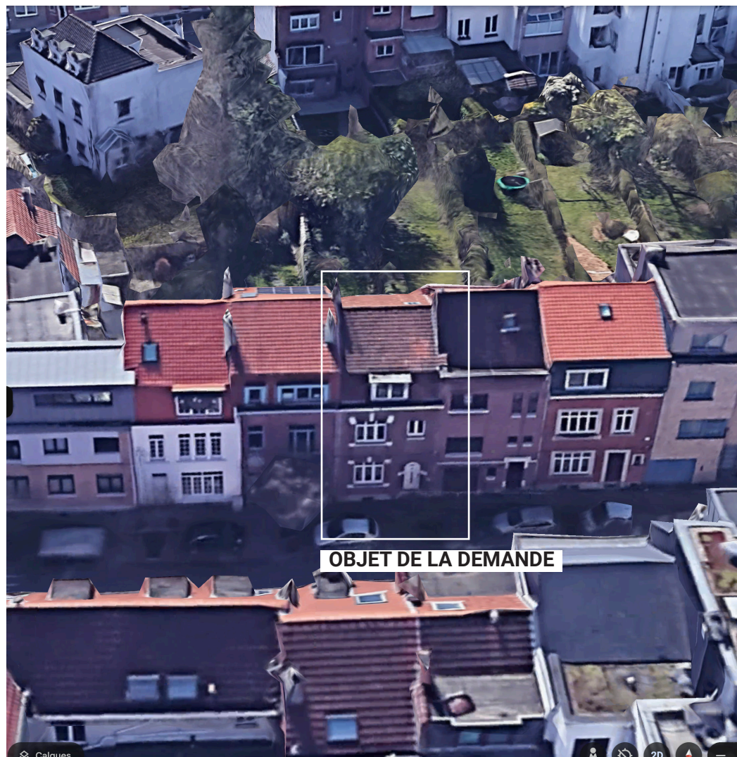
vue google earth - façade avant

Régularisation d'une maison unifamiliale située Avenue Pierre Devis 25 - 1160 Auderghem