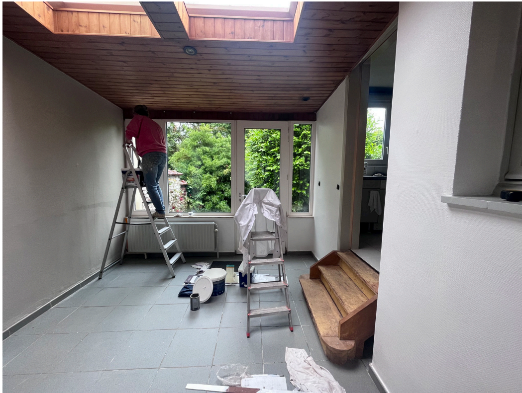
photo 05 : vue depuis l'intérieur vers extension coté salle à manger